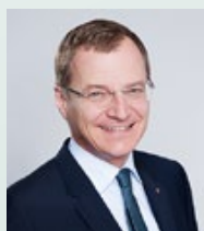
Mag. Thomas Stelzer Landeshauptmann